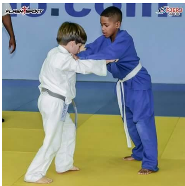
Judô infantil 2