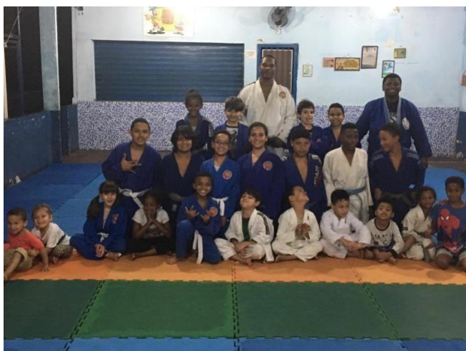
Judô infantil 1

Aulas de judô educativo, onde o ensino será abordado de forma lúdica. O trabalho será focado na formação psicomotora e no convívio social. Este estágio terá como abordagem o convívio social e o esporte de integração, e chegando a iniciação desportiva. Serão apresentados os ambientes competitivos e de bastidores.